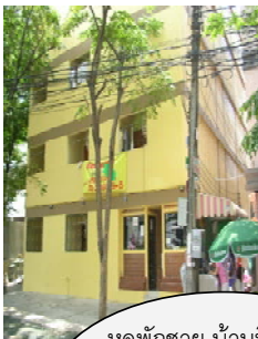
หอพักชาย บ้านนิภาภัทร โทร.0-2276-8035-6 ราคา 4,000 – 4,500 บ./ด