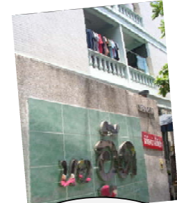
หอพักสตรี อู๊ด โทร.0-2275-1455-6 ราคา 3,200 บ./ด