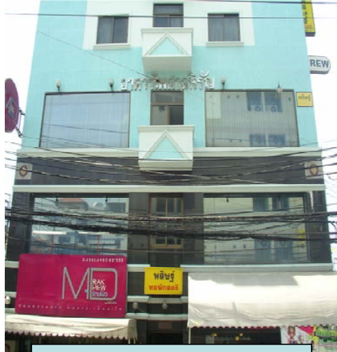
หอพักสตรีพิสิษฐ์ (หอพักดีเด่น) โทร.0-2692-2488 ต่อ 333,416 ราคา 4,000 – 4,500 บ./ด