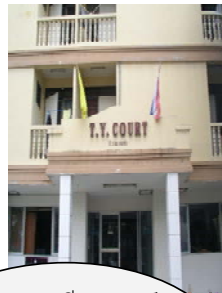
หอพักชาย ที.วาย.คอร์ท โทร. 0-2276-3207 ราคา 3,200 – 3,800 บ./ด