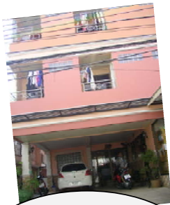
หอพักสตรี บ้านสิริสำราญ โทร.081-3114924 ราคา 3,500 – 4,000 บ./ด

มหาวิทยาลัยหอการค้าไทยร่วมกับกระทรวงพัฒนาสังคมและหน่วยงานที่เกี่ยวข้องประสานความร่วมมือกับผู้ประกอบการหอพัก ในมาตรการ การจัดระเบียบหอพักรอบมหาวิทยาลัยฯ เพื่อสร้างเครือข่ายหอพักนักศึกษา โดยมุ่งเน้นในด้านการคุ้มครองสวัสดิภาพ แก่นักศึกษา ได้อยู่ในหอพักที่จัดระเบียบถูกต้องตามกฎหมาย สะอาด สะดวก และปลอดภัย