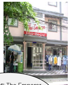
หอพักชาย The Emperor โทร.0-2694-2757 ราคา 3,000 – 3,500 บ./ด