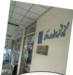
หอพักสตรี บ้านมาลินี โทร.0-2277-0609 ราคา 3,100 – 3,600 บ./ด